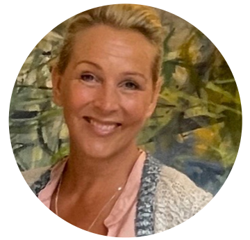
Ryttaryoga med bas i medicinsk yoga

När vi drar ihop oss eller när vi mobiliserar kraft gör vi en en psoas-aktivering. Vi skyddar vitala organ genom att dra ihop oss alternativt mobiliserar alla muskler vi kan runt höfterna som driver oss framåt med störst fysiskt kraft, och skapar därmed störst möjlighet för vår överlevnad.